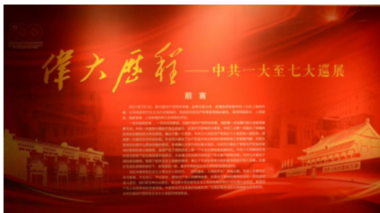
伟大历程——中共一大至七大巡展